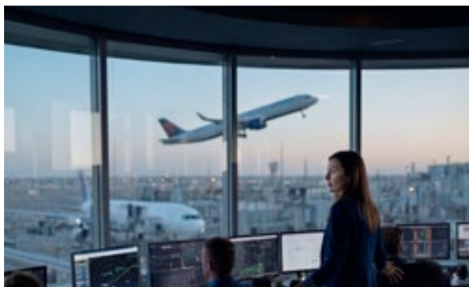
Transparente Daten. Effiziente Prozesse. Bessere Entscheidungen. PSIairport

Zur einfachen und transparenten Verknüpfung aller Flughafensysteme bieten wir Ihnen die Lösung PSIairport.